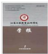
江苏工程职业技术学院学报