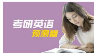
新东方考研英语预测卷 (3套)