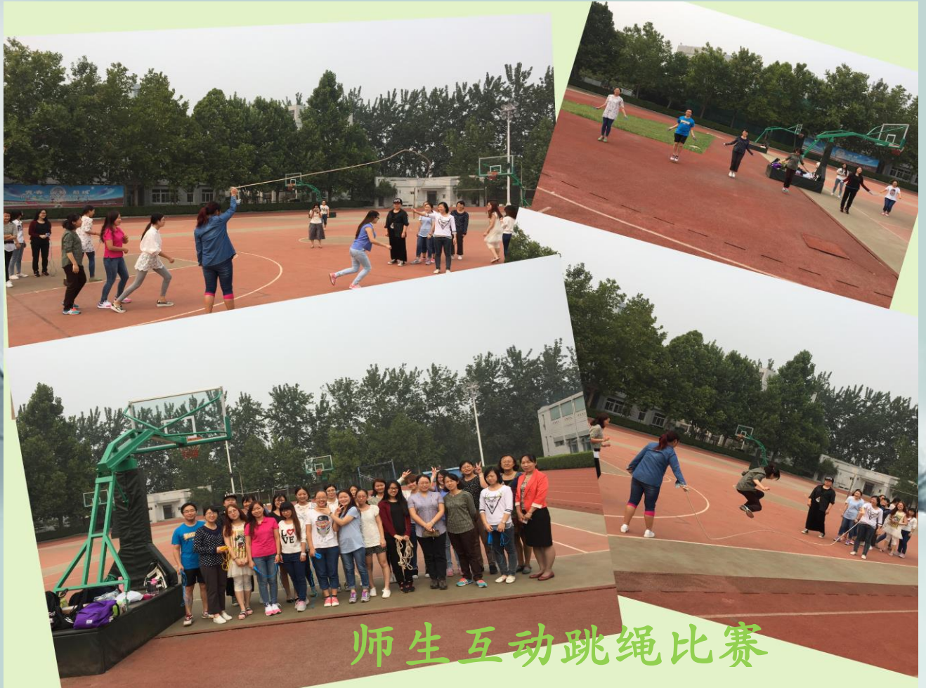
师生互动跳绳比赛